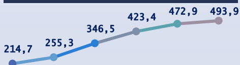
Объем производства в сфере машиностроения Гродненской области, 2015–2020, млн руб