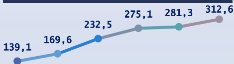
Объем производства деревообработки Гродненской области, 2016–2020, млн руб